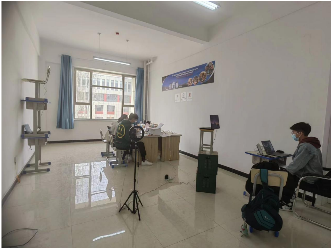
(新疆理工学院赛点)

新疆大学软件学院承办 2022 年国际大学生程序设计竞赛 (ACM-ICPC) 新疆赛区省赛, 意在让学生感受比赛氛围, 与新疆各高校的学生同台竞技, 相互学习, 提高专业技能, 鼓励学生总结经验, 以赛励学, 在学校“创新实践教学模式, 培养高素质创新人才”方针引领下, 按照大学紧扣应用型人才培养模式改革内涵新要求, 以稳步提升学生个人专业素养与科技实践能力为目标, 以教风、学风建设为抓手, 积极鼓励学生参加各类型学科竞赛、科技竞赛, 力求从低年级抓牢科技实践阵地, 全力提升学生科技创新实践能力。