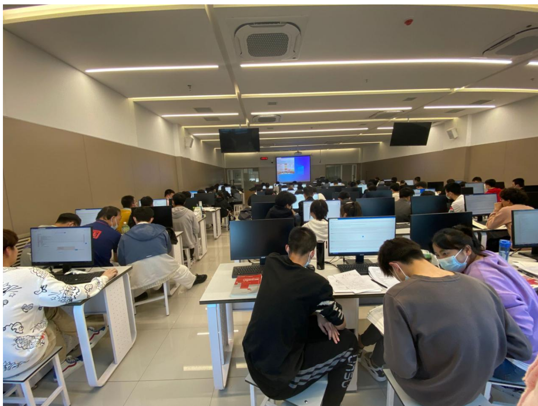
(新疆大学博达校区赛点)